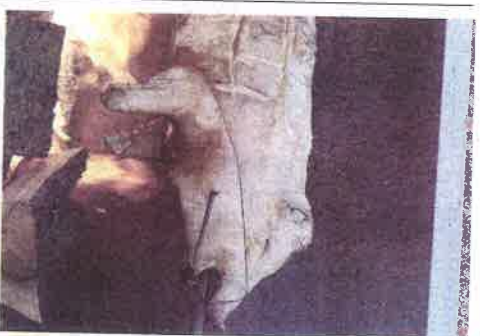
DEN vzniku samostatného česko-slovenského štátu byl připomenut také v Děkově. Fotografie nám do redakce zaslal Vladimír Kozák.