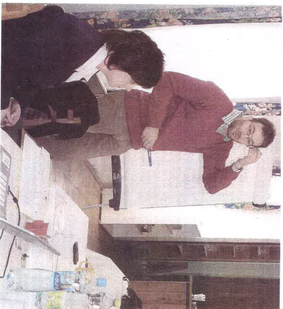
ANTIKOMPLEX při setkání s občany v Děkově.

Po získání dotace na opravu drobných památek a jejich zdárné opravení vše směřovalo k otázce, kdy tento slavnostní den zopakovat, a tak přišel návrh. Kdy jindy, než v den, kdy naše republika slaví narozeniny. Přípravy začaly nabírat na obrátkách, ve vzduchu byl šon a stres z toho, aby bylo vše dokonale a alespoň maličko se to přiblížilo našim předkům. 17 hasičských sborů? Pévecký sbor o 32 hlasech? Některý z poslan-